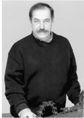
Pierre Granche Photographe non identifié Source : Fonds Pierre Granche (P 320) Division des archives, Université de Montréal